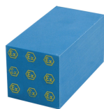
Plný kompenzační modul RM Ex