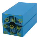
Modul RM Ex s technologií Multidiameter™